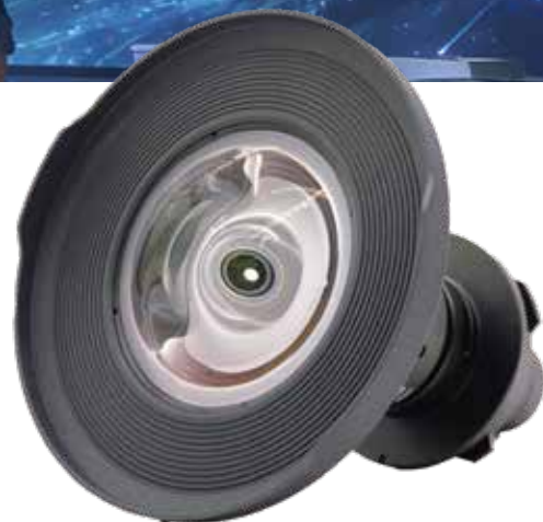
型 號:ML-PR0312Z 投射比:0.31-0.32:1